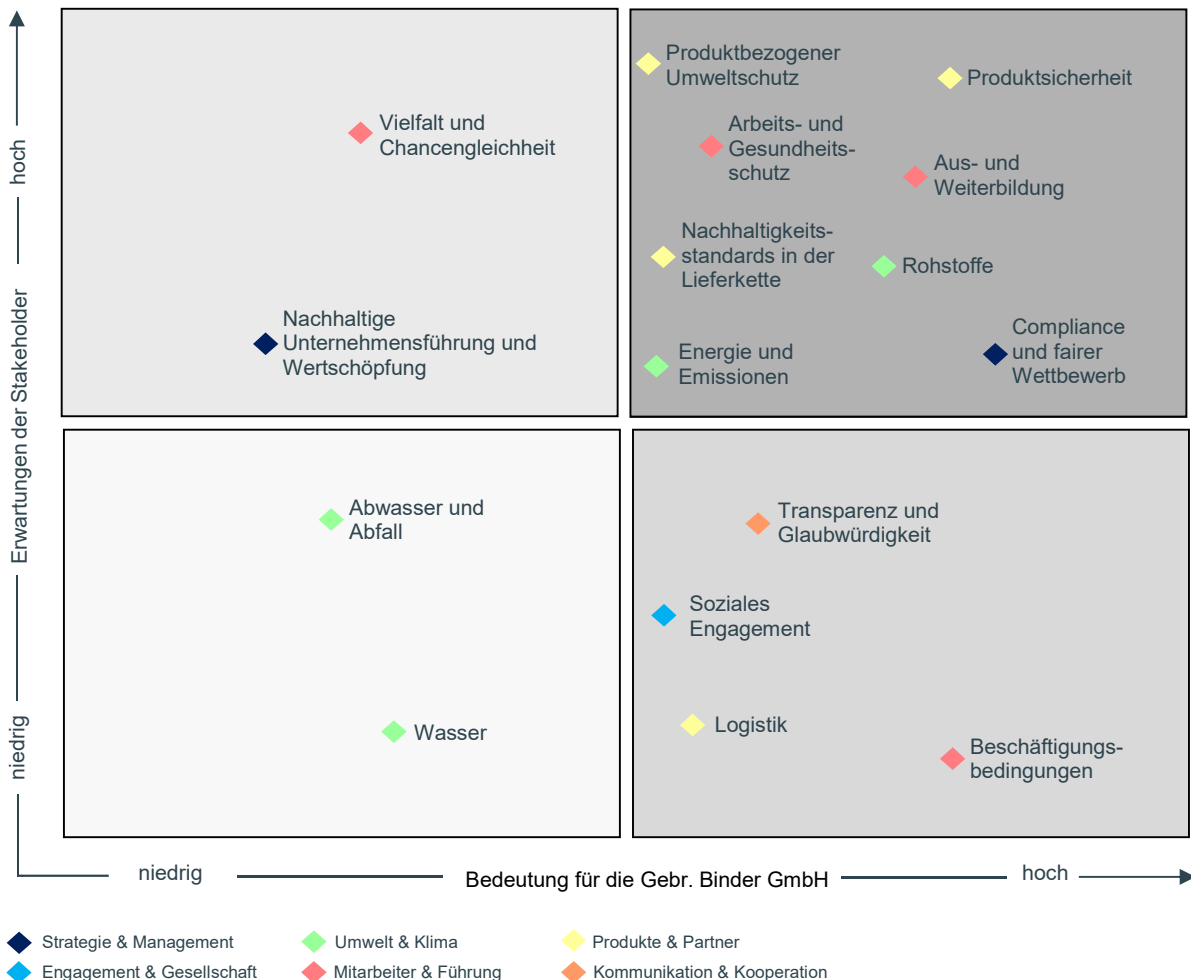
Wesentlichkeitsmatrix der Gebr. Binder GmbH