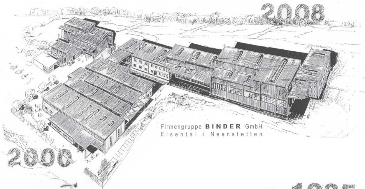
Firmengruppe BINDER GmbH Eisental / Neenstetten