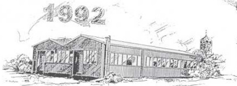
Gebr. BINDER GmbH Weidenstetten